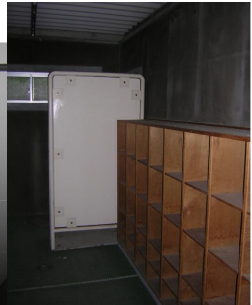
目隠し板(フレキシブルボード)