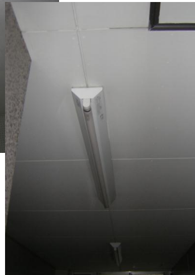
天井(珪酸カルシウム板)