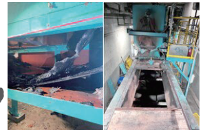
火災による設備被害

令和7年12月3日、クリーンセンター東工場内第二破砕施設において火災が発生しました。 発火原因はリチウムイオン電池など小型充電式電池類の可能性が考えられます。