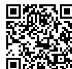
まちづくり出前講座メニュー

【E-7】「紙類のリサイクルでエコ活をすすめよう ～集団回収報償金アップの秘策伝授します！」の 講座参加者にもお渡しできます！ ぜひお申込みください。