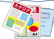
● チラシ パンフレット