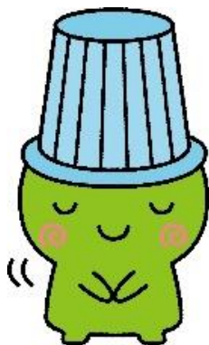
堺市環境マスコット キャラクター「ムーヤん」