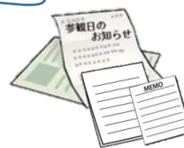
● メモ用紙 プリント類