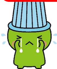
堺市環境マスコットキャラクター「ムーヤん」