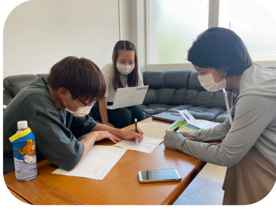
ミーティングの様子