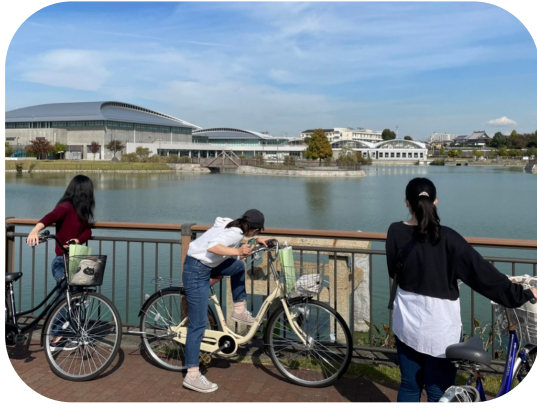
自転車で中区内散策

2021年9月から中百舌鳥キャンパスのある堺市中区をより良くするために、フィールドワークやミーティングを重ね、中区役所と一緒に考えてきました。