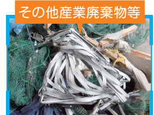
その他産業廃棄物等