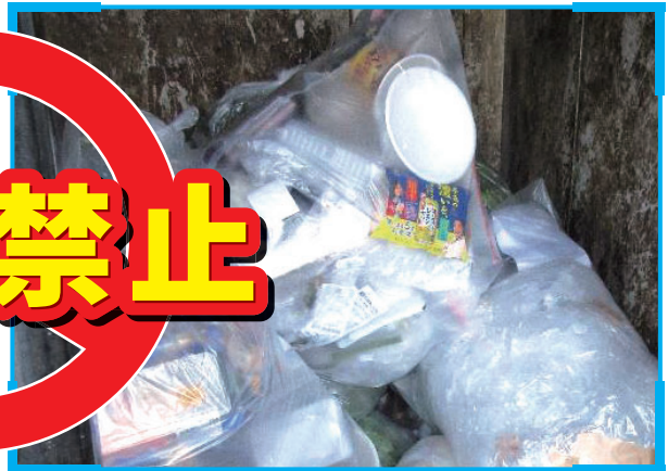
トレイなどプラスチック製容器の混入