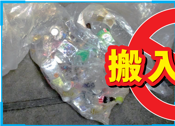
缶、びん、ペットボトルの混入

事業所から出るごみのうち、缶、びん、プラスチック類（ペットボトルや弁当の容器、お菓子の袋など）は、汚れの有無にかかわらず 産業廃棄物 に該当するため、清掃工場に搬入できません。事業所での適正な分別・処分をお願いします。不適正な排出がある場合は事業所への立入検査を行うこともあります。