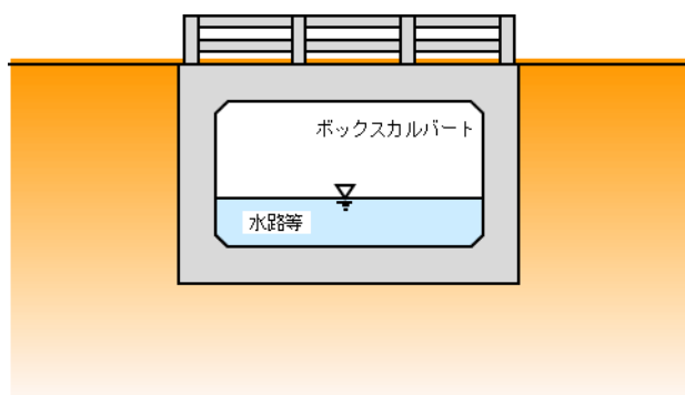
図1 ボックスカルバート形式の橋りょう

※ 耐震化済みの橋りょう（耐震強化が不要な橋りょうを含む） とは、「耐震補強工事を実施した橋りょう」、「耐震補強が不要と確認できた橋りょう」のほか「ボックスカルバート形式の橋りょう」（図1）、「橋長15m未満の小規模な橋りょう」（図2）等、落橋の可能性が極めて低い橋りょうも含まれます。