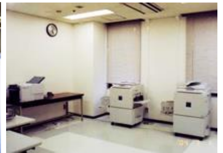
ワークステーション