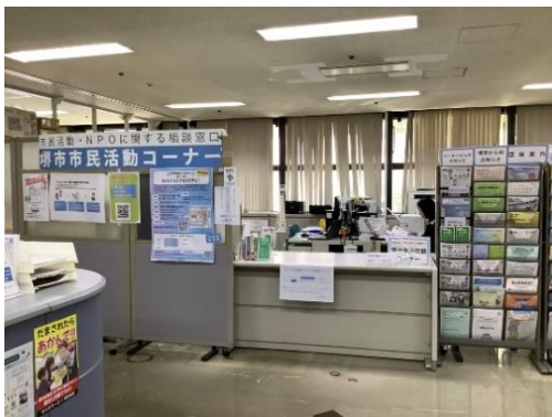
堺市市民活動コーナー受付

市民活動に関する情報の収集・提供、NPO法人の設立・運営等に関する相談、NPO運営力強化セミナーの実施、NPO法人等個別支援、協働コーディネーターによるマッチング等