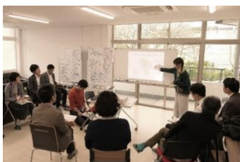
大阪公立大学ボランティア・市民活動センター（V-station）社会貢献セミナーの様子