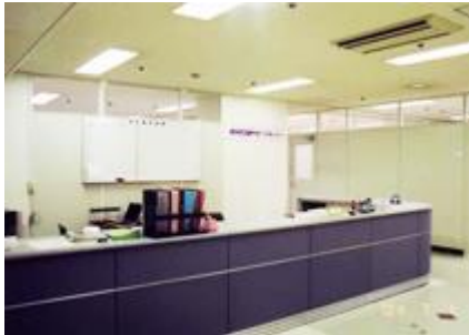
堺市民活動サポートセンター 受付

貸出サービス（事務所、簡易事務所、ロッカー、メールボックス）、ミーティングルーム、ワークステーション（印刷機、紙折機、裁断機）など