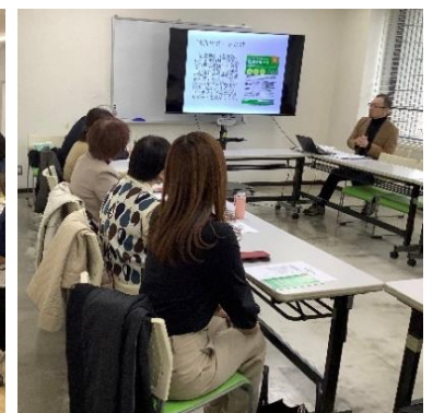
個別サポート成果報告会