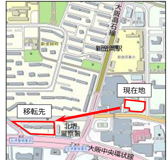
北部地域整備事務所の周辺図