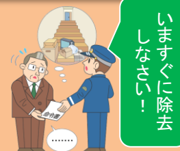
消防吏員からの除去命令