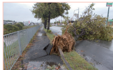
平成30年9月台風21号 倒木被害(府道堺かつらぎ線)