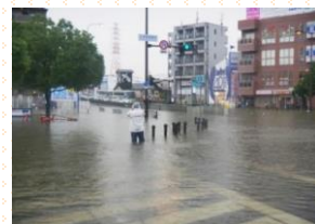
過去に市内で発生した浸水被害