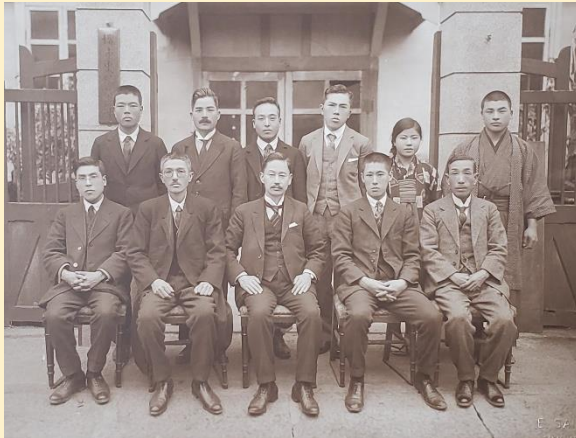
『堺市史史料写真編』「堺市史編纂部員」

『堺市史』編纂のため収集した、史料の複製や模写した絵図・写真などを堺市立中央図書館で保存しています。これらの所蔵資料と解説パネルを展示し、市史編纂事業の歴史を紹介します。