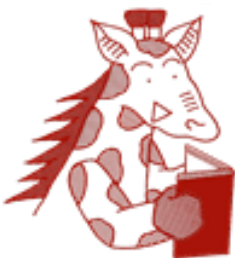
美原図書館シンボルキャラクター ブックリン