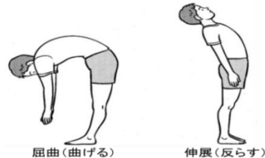
図2. 腰を曲げたり反らしたりすると痛みがある