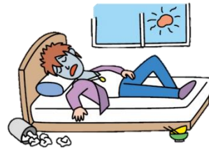
無動機症候群 何もやる気がしない