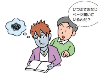
知的機能の低下 ものを考えられなくなる