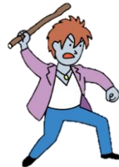
大麻精神病 幻覚・幻聴などの症状 暴力をふるう