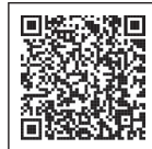
さかいっこひろば