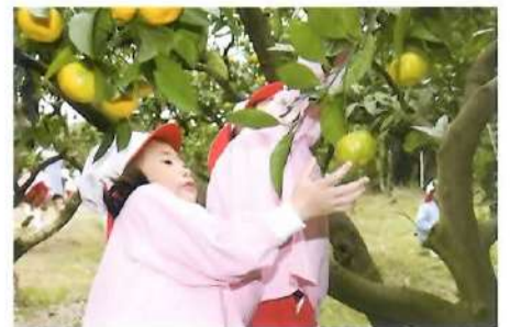
■園外保育(みかん狩り)