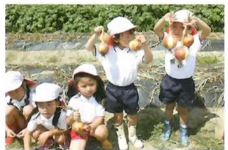
■ たまねぎ掘り（園外）