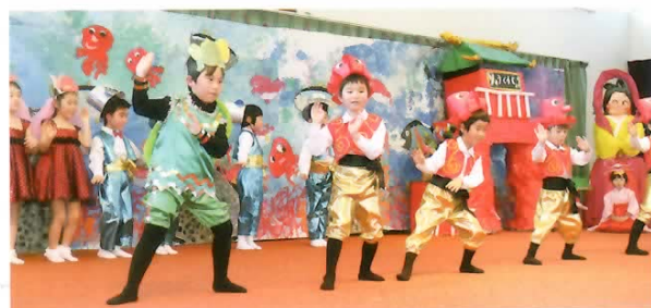
■ミュージカル バックの絵・飾り物は子どもたちの作品