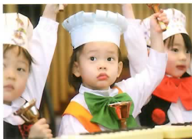
■合奏 ピアニカとハンドベルを持ち替えて