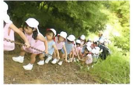
■お泊まり保育(園外) 険しいガケ登りに挑戦