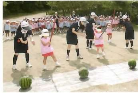
■お泊まり保育(園外) すいか割り「がんばれ!がんばれ!」の大声援