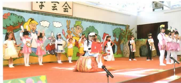
■劇 バックの絵・飾り物は子どもたちの作品