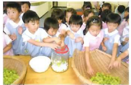
■ 梅ジュース作り（園内）