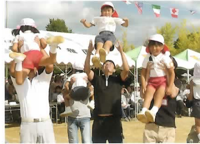
■親子競技のバンザイ