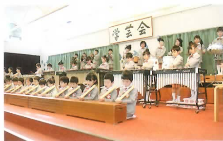
■合奏 本物の楽器ですばらしい演奏を