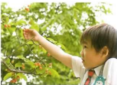
■ さくらんぼ収穫（園内）