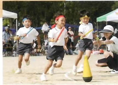
■年長 リレー クラス対抗