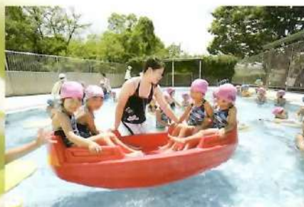
■ プール 夏はパンジョスイミングと園のプール