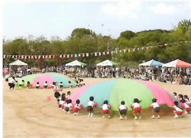
■年中 パラパレード 腕にはお花を