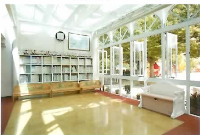
フリーライブラリー