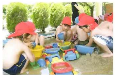
■ 泥んこ遊び お山や川にお魚、お船がスイスイイ