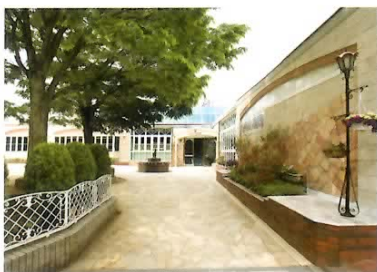
正門からのアプローチ