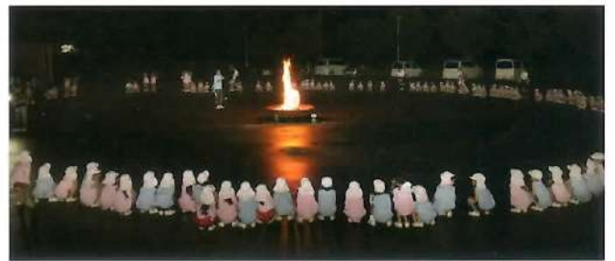
■お泊まり保育(園外) シャボン玉とキャンプファイヤー、花火