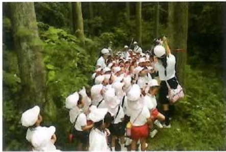
■お泊まり保育(園外) お山探検・宝探し