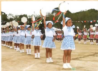
■年長 タンバリンのリズム