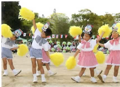
■年少 リズム 自分で作ったお面を付けて