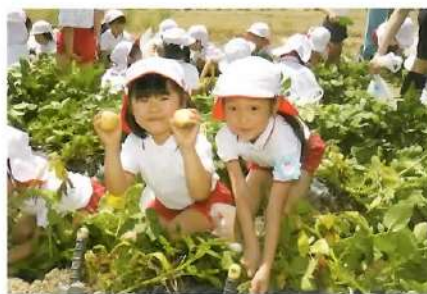
■ じゃがいも掘り（園外）