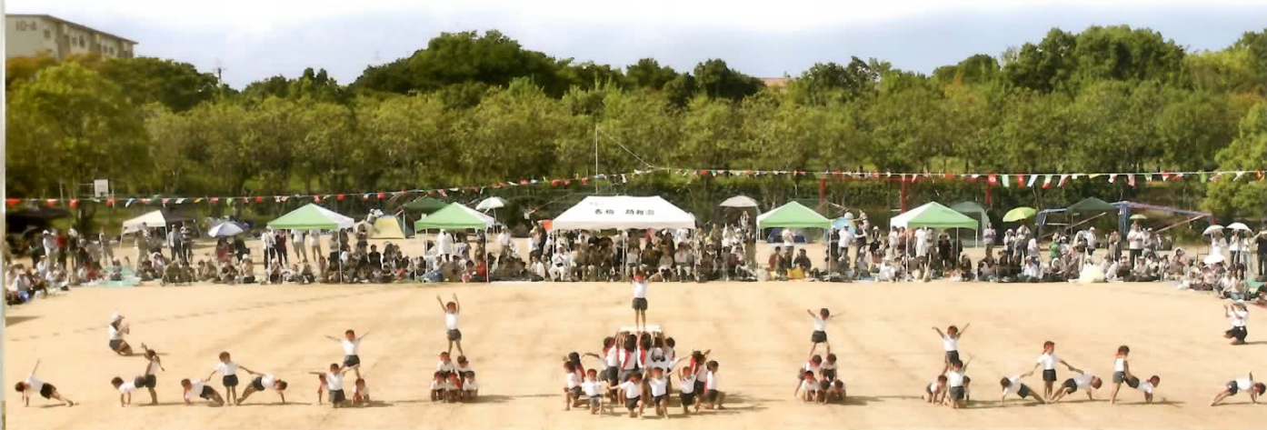
■大太鼓の音に合わせて凛々しい年長男児