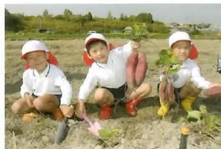
■さつまいも掘り(園外)