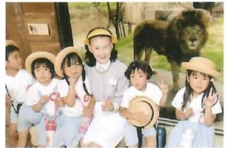
■ 園外保育（天王寺動物園）