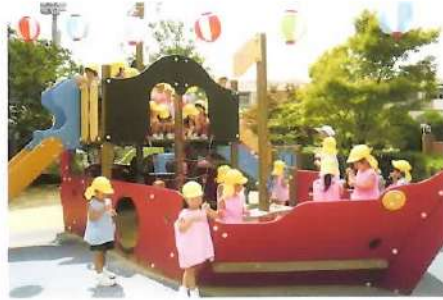
■海賊船で楽しいシャボン玉