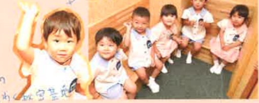
みんなの あそび場