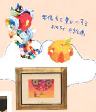
想像力を豊かにする お絵かき絵画