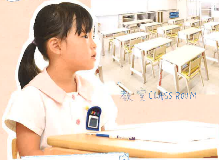
教室 CLASS ROOM