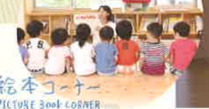
絵本コーナー PICTURE BOOK CORNER