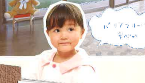
バリアフリー 安心の 園舎