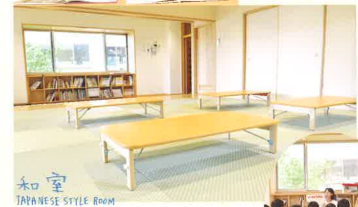
和室 JAPANESE STYLE ROOM