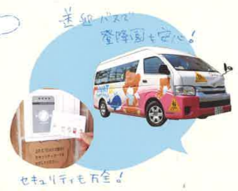
セキュリティも万全!