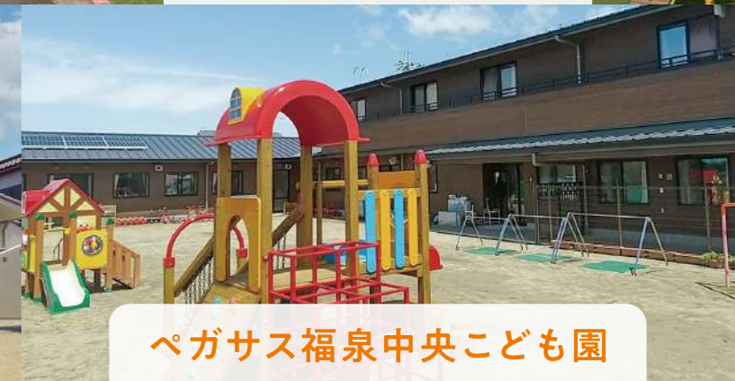
ペガサス福泉中央こども園