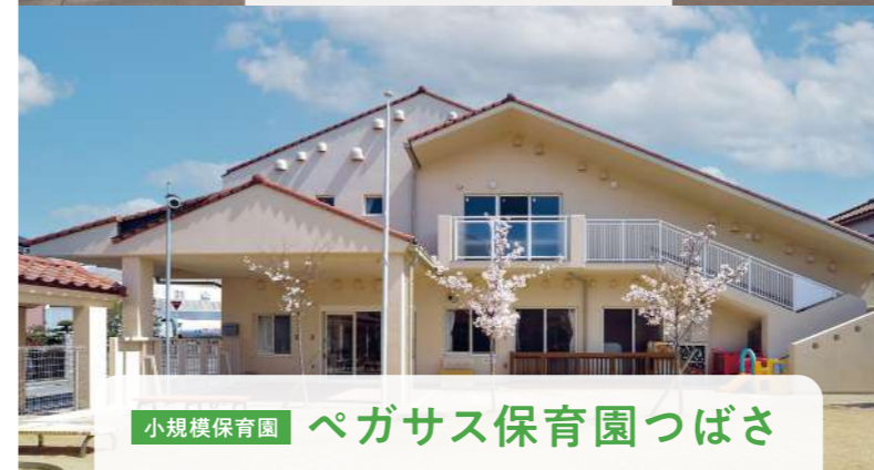
小規模保育園 ペガサス保育園つばさ