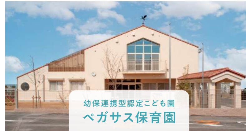
幼保連携型認定こども園 ペガサス保育園

子ども一人ひとりの「今」をそして心を大切に、保護者や地域社会と共に 全ての子どもが人間らしく生きるための基礎となる力を育てる。