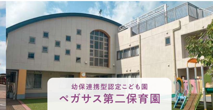
幼保連携型認定こども園 ペガサス第二保育園