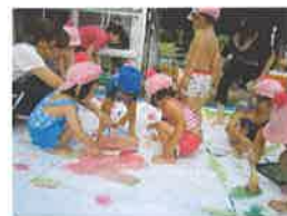
ボディペインティング