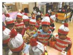
お店屋さんごっこ