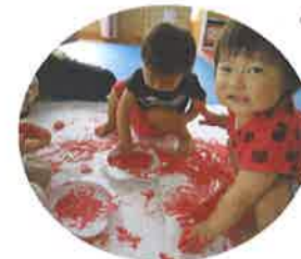
スタンピング遊び