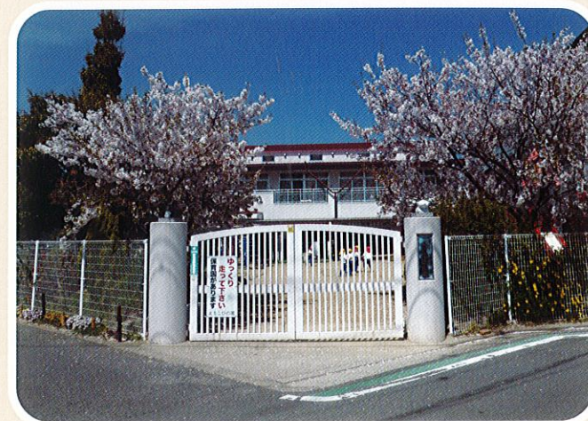
0才～就学前までの90名定員の保育園