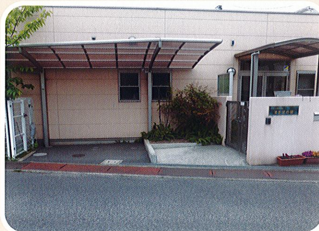
0才～2才までの30名定員の保育園