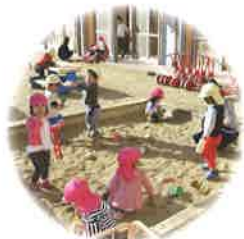
健康なからだで 充分あそぶ子ども