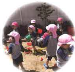
だれとでも 仲良く遊べる子ども