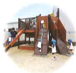
自ら行動できる 子ども