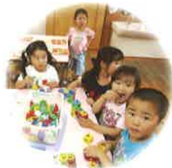
仲間を大切にし、 共に考え力を合わせて 行動する子ども