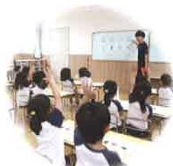
よく見てよく考える 子ども