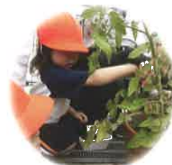
自然や動物に興味を持ち、 命の尊さを知る子ども