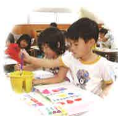
豊かな感性を持ち、 表現できる子ども