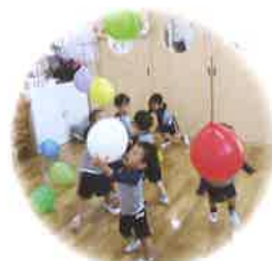
明るく いきいきとした子ども