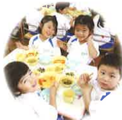
基本的生活習慣を 身につけた子ども