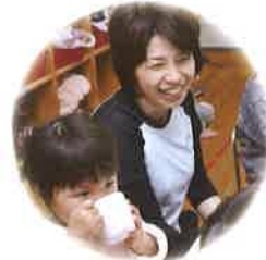
物を大切にし、 生き物に親しむ子ども