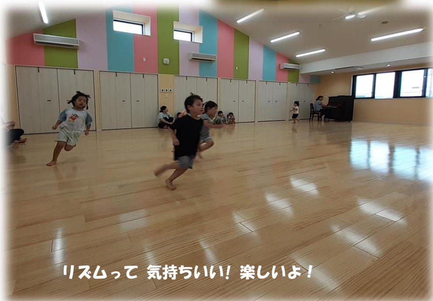
リズムって 気持ちいい! 楽しいよ!