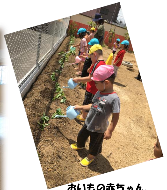
おいもの赤ちゃん、 お水をどうぞ