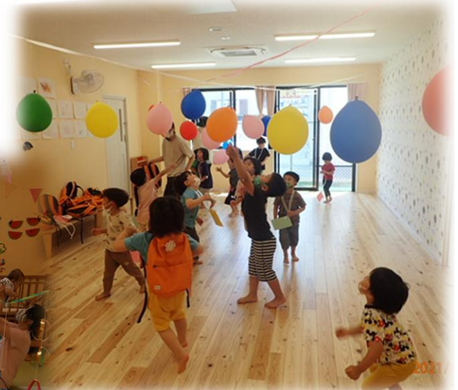
わーい ふうせんにジャンプ!