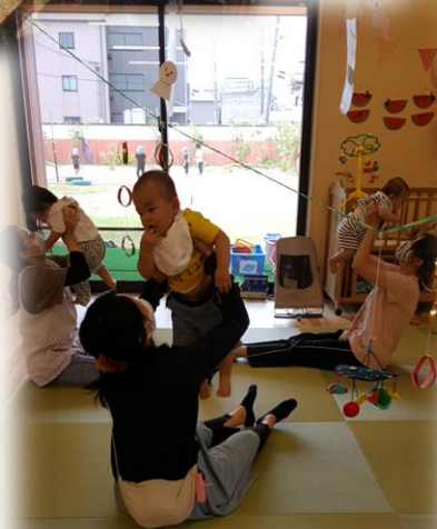
高い〜高い〜! おめめ合わせて 楽しいね♪