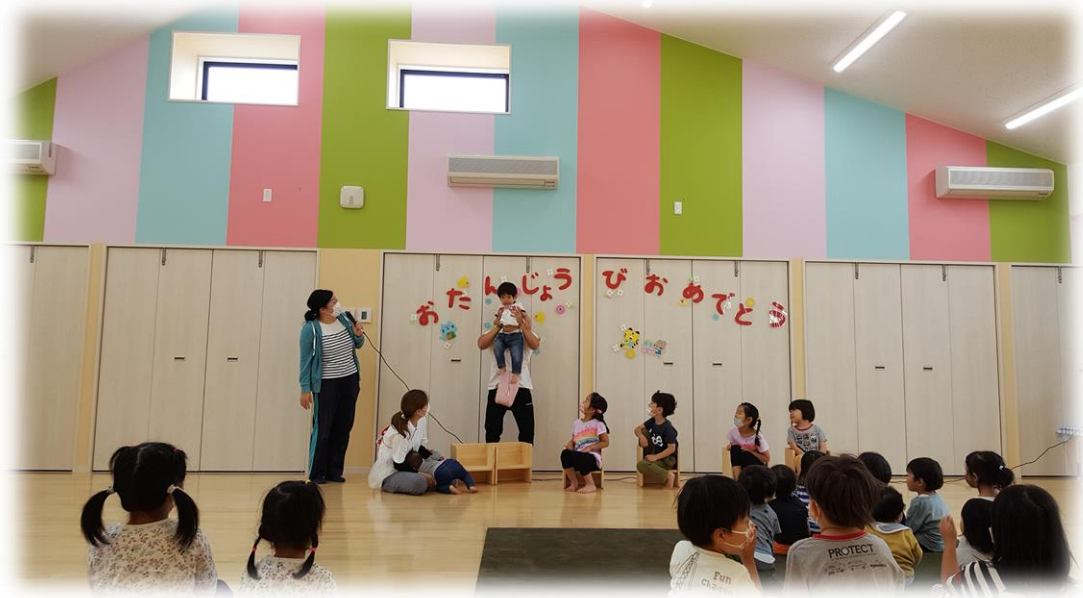
広いホールで誕生会 先生から たか〜い 抱っこのおプレゼント♪