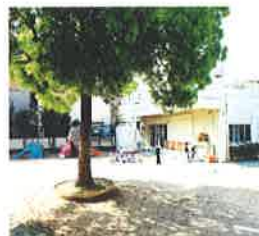
園庭のシンボルツリー