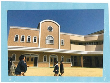
堺めぐみ学園・園舎