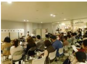
「邦楽合奏団 地湧 ふれあいコンサート」の様子