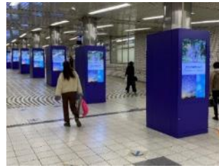
大阪メトロなかもず駅で(R5年3月)