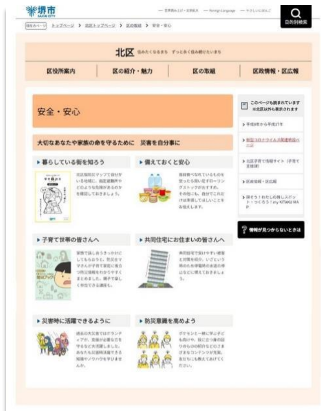
防災特設ページイメージ