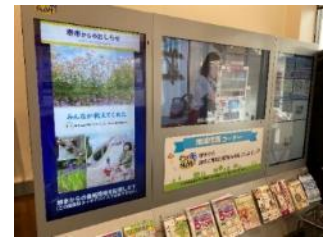
そよ新金岡で(R5年3月～)