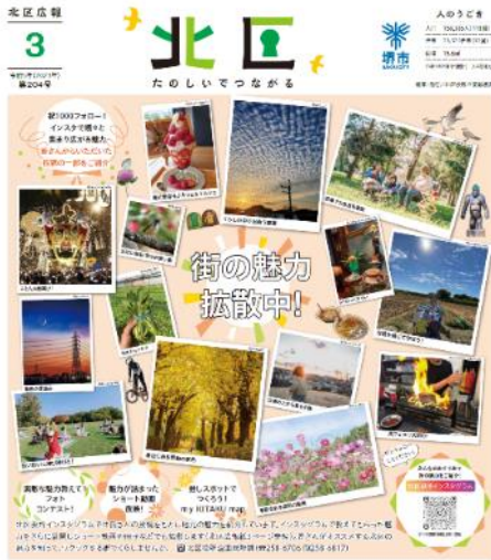
北区広報紙で (R4年8月・R5年4・5・6・8月号)