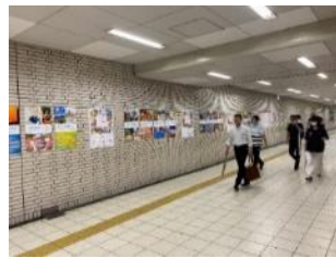
大阪メトロ新金岡駅で(R5年6月)