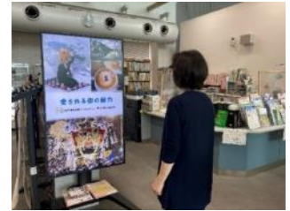
北区役所市政情報コーナーで(R5年3月～)