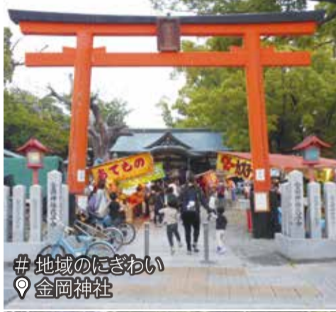
# 地域のにぎわい 金岡神社