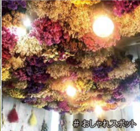
# おしゃれスポット