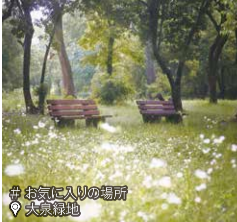
# お気に入りの場所 大泉緑地