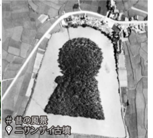
# 昔の風景 ニザンザイ古墳