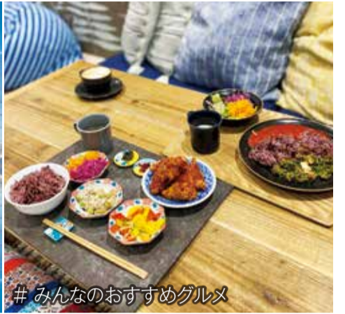
# みんなのおすすめグルメ