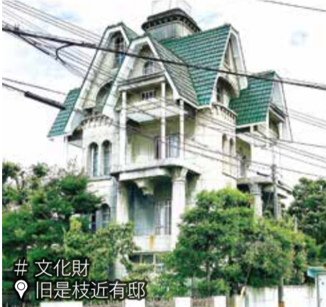
# 文化財 旧是枝近有邸