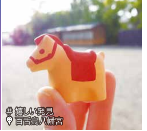
# 嬉しい発見 百舌鳥八幡宮