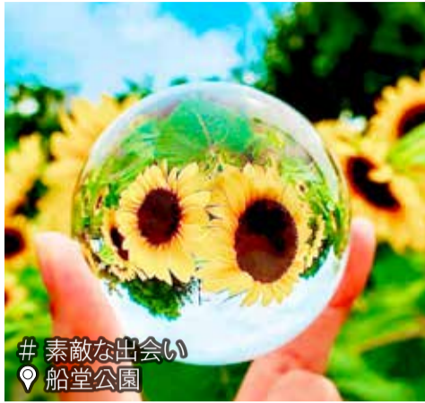
# 素敵な出会い 船堂公園