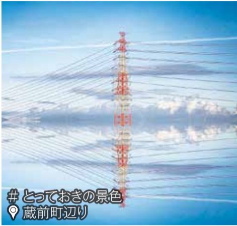
# とっておきの景色 蔵前町辺り