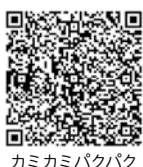
カミカミパクパク離乳食

○表の事業の予約・登録は同センターへ(予約制・登録制の事業は定員になり次第、締め切りますので、ご了承ください)。 ○表以外にも次の健(検)診、相談を行っています。 ・4カ月児健診、1歳6カ月児健診、3歳児健診(3歳6カ月児が対象)…個別に通知します。 ・育児相談 ・難病相談 ・検便(腸内病原菌)検査は令和3年3月末で終了しました。