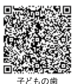
子どもの歯相談室