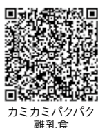
カミカミパクパク 離乳食

○表の事業の予約・登録は保健センターへ(予約制・登録制の事業は定員になり次第、締め切りますので、ご了承ください)。 ○表以外にも次の健(検)診、相談を行っています。 ・4カ月児健診、1歳6カ月児健診、3歳児健診(3歳6カ月児が対象)…個別に通知します。 ・育児相談 ・難病相談 ・検便(腸内病原菌)検査は令和3年3月末で終了しました。