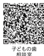
子どもの歯 相談室