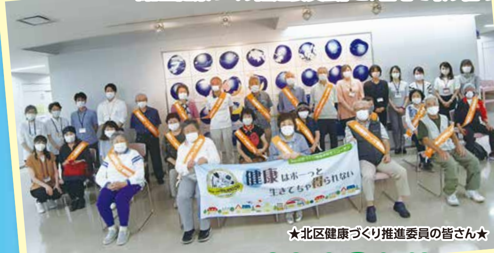
★北区健康づくり推進委員の皆さん★

上記スローガンのもと、感染対策を行いながら、官民協働で北区民の健康づくりを応援している「北区健康づくり推進委員会」と、自宅で取り組める健康づくりの動画などを紹介します!!