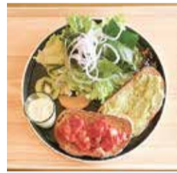
「ベーコントマトとアボカドのトーストプレート」

新鮮な青果を扱う市場の自信と誇りを持って「産地と消費者」「市場と地域」「人と人」がつながるように、皆さんの日常に寄り添ったお店作りをしていきます!