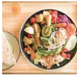
たっぷり野菜とピタパンで大満足「サラダプレート」