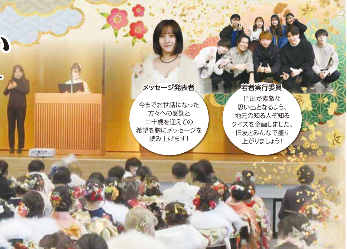
メッセージ発表者

今までお世話になった方々への感謝と二十歳を迎える希望を胸にメッセージを読み上げます!