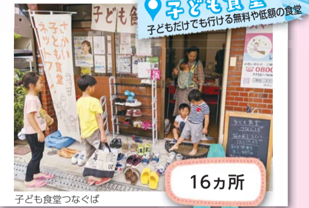
子ども食堂つなぐば