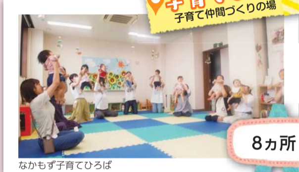
なかもず子育てひろば