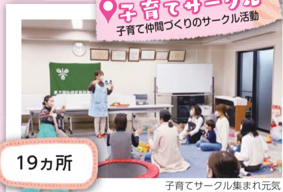
子育てサークル集まれ元気