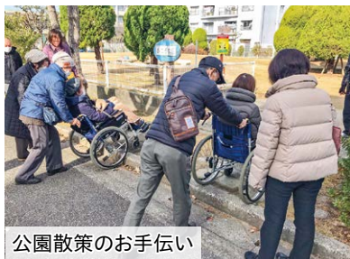
公園散策のお手伝い

活動の中では、接する方の笑顔に元気をもらったり、子どもの発想力に気付かされたり心地よい刺激がたくさんあります。そして、活動で得た知識やノウハウは自身の生活にも活かされます。また、行動範囲も広がり、新たな発見にも出くわします。人のためにというよりも、自分に返ってくる活動だと感じます。