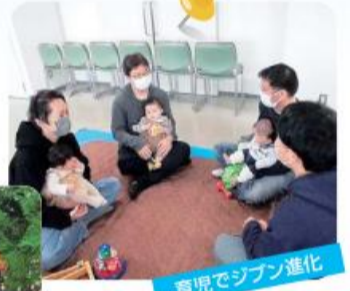
育児でジブン進化