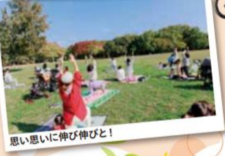
思い思いに伸び伸びと!