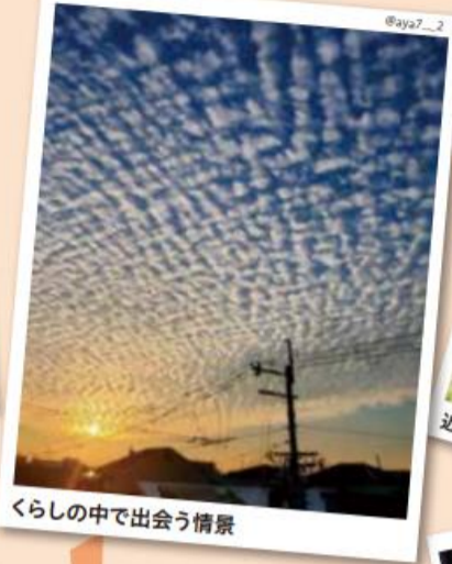
くらしの中で出会う情景