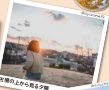
古墳の上から見る夕陽