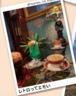
レトロってエモい