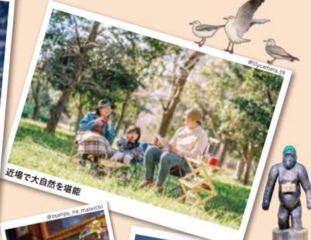
近場で大自然を堪能