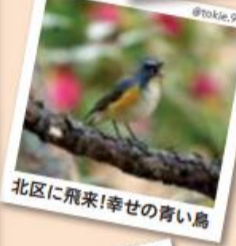
北区に飛来!幸せの青い鳥