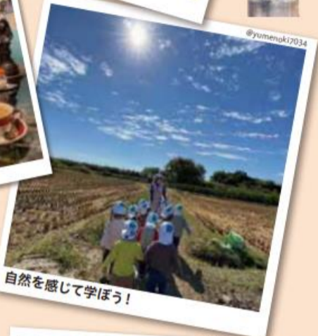
自然を感じて学ぼう!