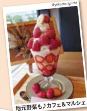
地元野菜も♪カフェ&マルシェ

祝1000フォロー! インスタで続々と 集まり広がる魅力 皆さんからいただいた 投稿の一部をご紹介します