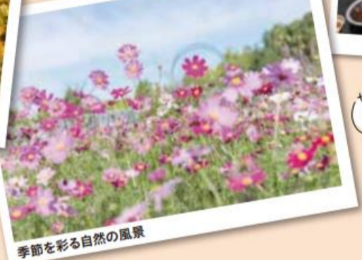
季節を彩る自然の風景