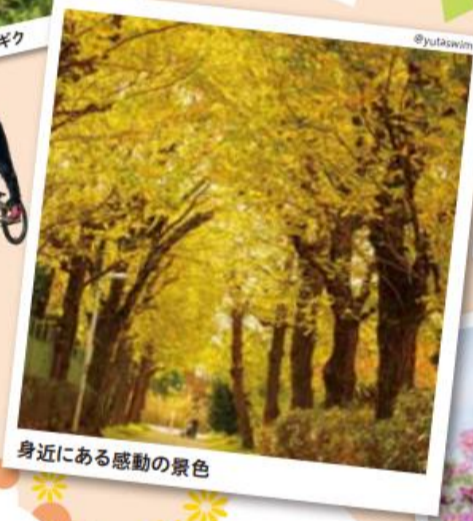
身近にある感動の景色