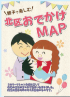
親子で楽しむ 北区おでかけ MAP