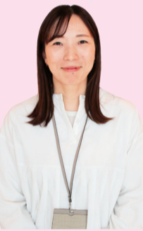
子育て支援課相談員