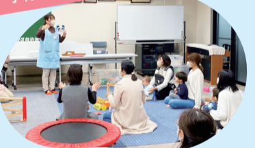
子育て中の方や地域の方が 親子のふれあいの場をつくってあります (月1~2回程度)