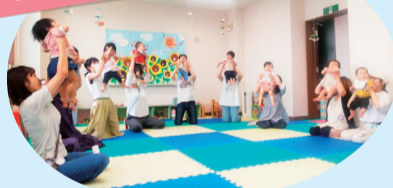
親子が気軽に集い交流できる 常設のひろばです (週4~5回程度)