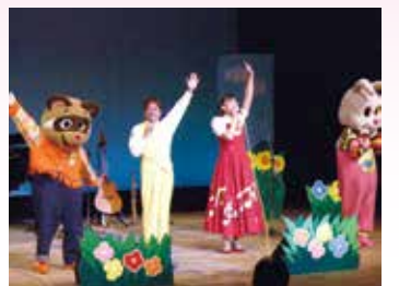
心ほかほかコンサート

☎ 北区子育てフェスタ実行委員会事務局(北区役所企画総務課内 ☎258-6706 FAX258-6817)へ