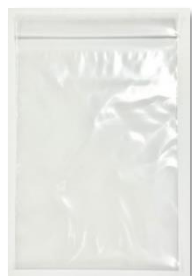
チャックつきビニール袋