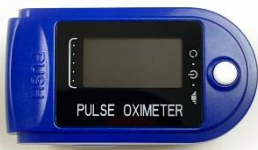
パルスオキシメーター