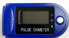
パルスオキシメーター

きれいに拭いたパルスオキシメーターをチャックつきビニール袋に入れ、袋の中の空気を抜いてチャックを閉じる。（パルスオキシメーターの清掃方法については裏面をご覧ください。）