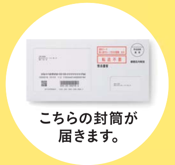
こちらの封筒が 届きます。

※10月5日時点の住民票に記載されている住所(居所を登録された方は当該居所)に届きます。