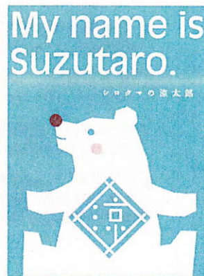
キャンペーン キャラクター 「涼太郎」