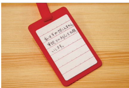
▲ 裏面にシールを貼り、必要な情報を記載することができます。