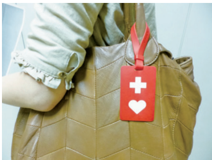
▲ 鞆等につけることができます。