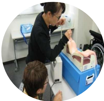
模型や器具を使用した実技指導 ※写真はイメージです

当講習は、 感染予防対策 を実施し運営します。ただし状況により受講者や関係者の安全確保などのため、カリキュラム等(施設見学、介護現場実習含む)の内容等が変更となる場合があります。