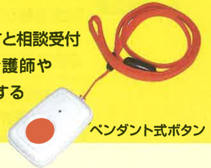
ペンダント式ボタン

また、相談通報用ボタンを押すと相談受付センターにつながり、専門の看護師や保健師に健康面などの相談をすることができます。