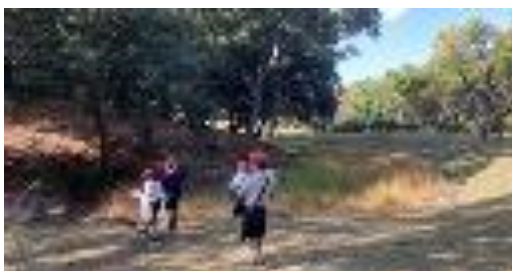
小学生授業 オリエンテーション（旗塚古墳）