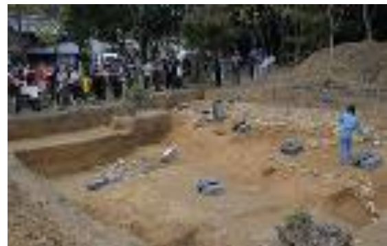
寺山南山古墳発掘調査現地説明会