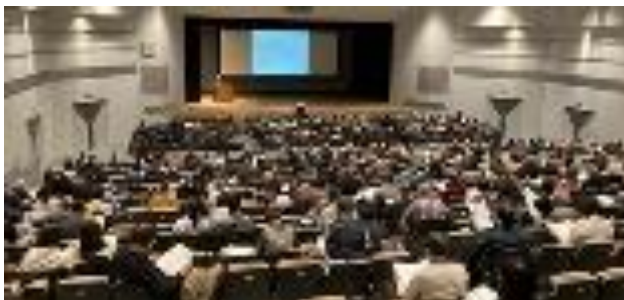
百舌鳥古墳群魅力発掘講演会