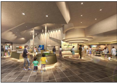
ビジターセンター内観