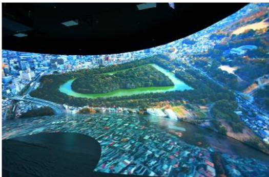
シアター画像(ビジターセンター内)