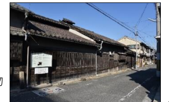
歴史的風致維持形成建造物 井上関右衛門家住宅