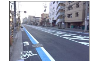
錦南宗寺線整備状況