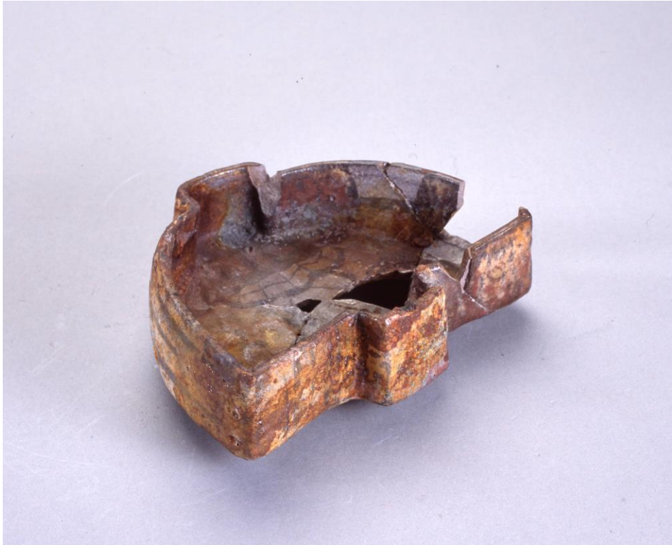
堺環濠都市遺跡（SKT39 地点）SB301 出土 青織部向付（リスト No17）