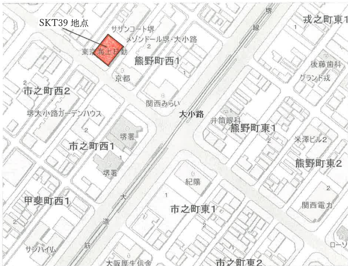
堺環濠都市遺跡 (SKT39 地点) 位置図 (S=1/2,500)