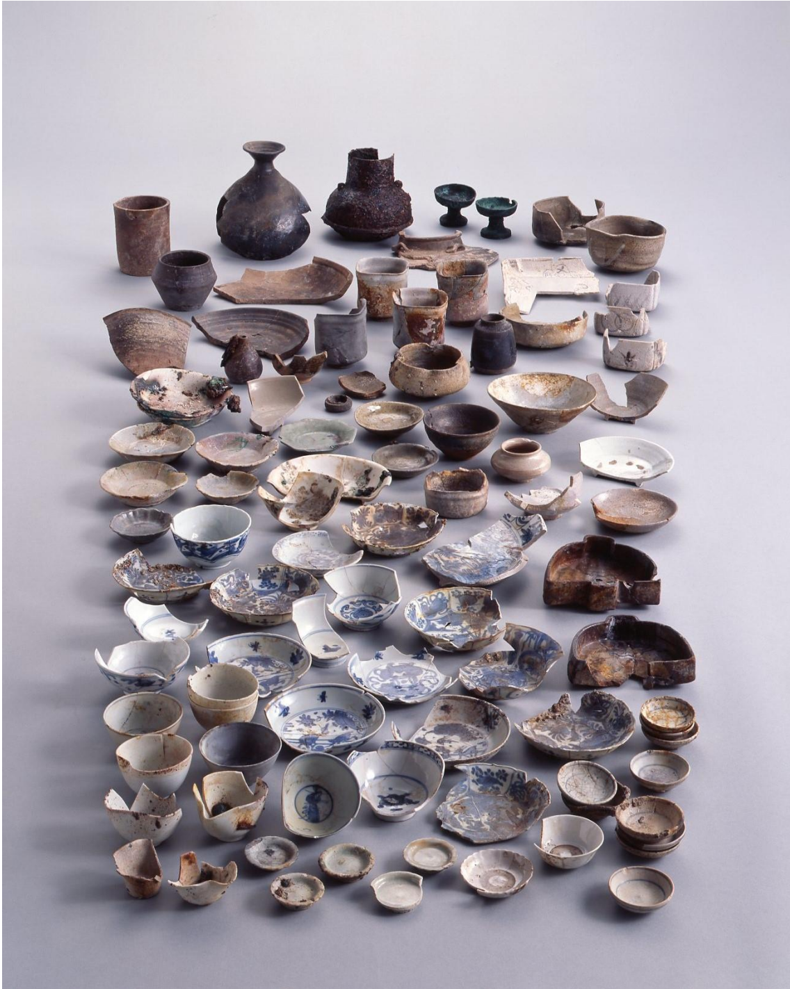
堺環濠都市遺跡（SKT39 地点） 博列建物跡 SB301 出土一括遺物 （堺市博物館 2006 年 『茶道具拝見 - 出土品から見た堺の茶の湯 - 』より）