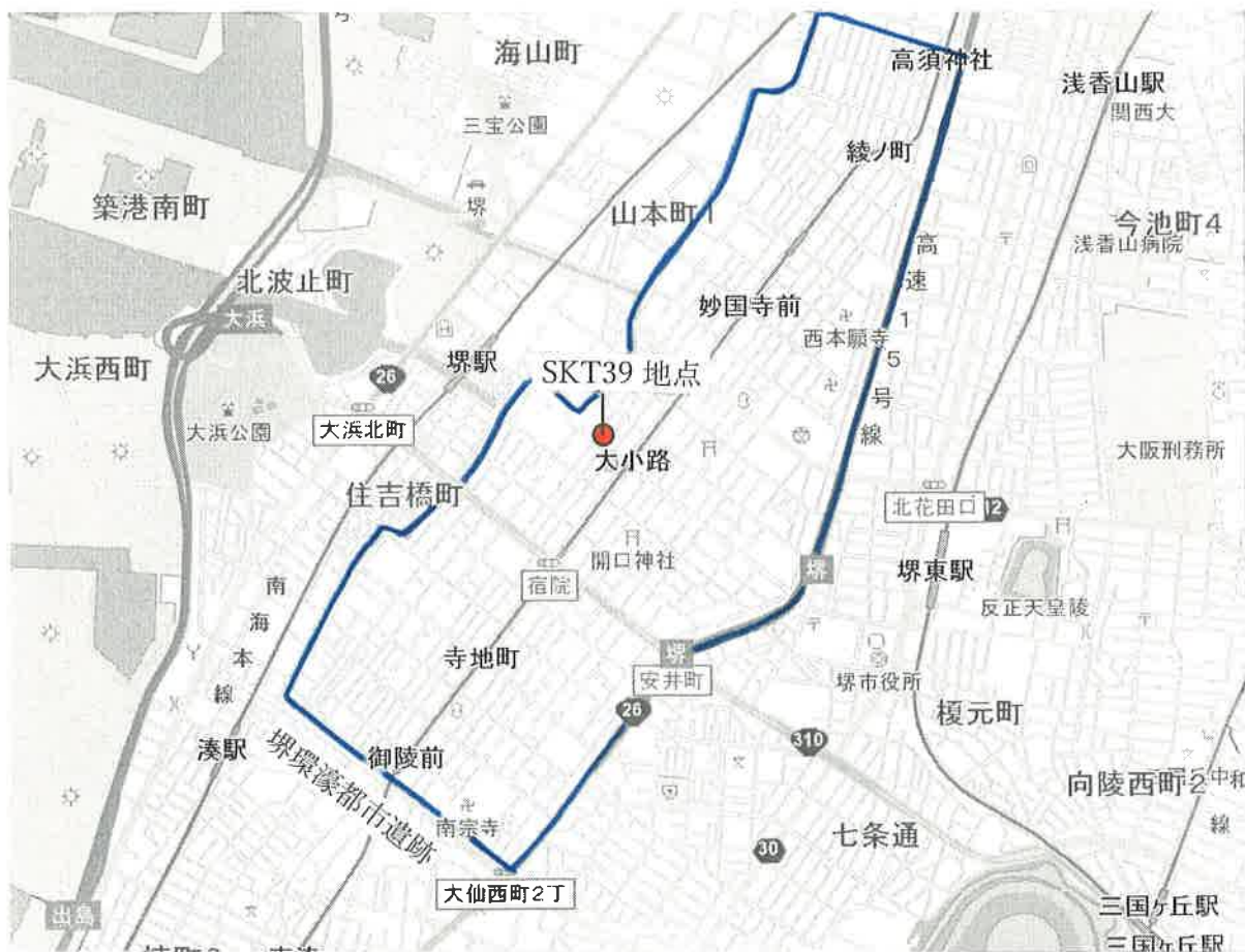
堺環濠都市遺跡 (SKT39 地点) 位置図 (S=1/25,000)