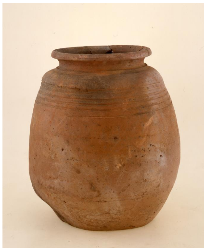
堺環濠都市遺跡（SKT39 地点）SB302 出土 タイ焼締壺（リスト No124）