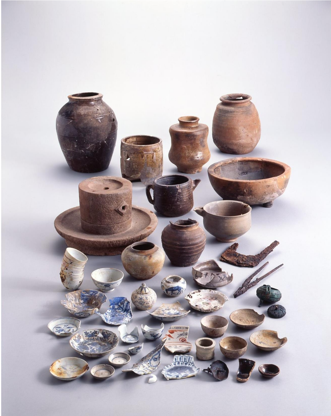
堺環濠都市遺跡（SKT39 地点） 博列建物跡 SB302 出土一括遺物 （堺市博物館 2006 年 『茶道具拝見 - 出土品から見た堺の茶の湯 - 』より）