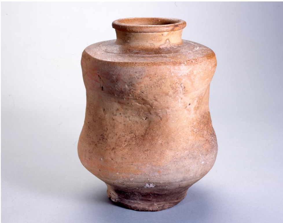
堺環濠都市遺跡（SKT39 地点）SB302 出土 伊賀信楽葉茶壺（リスト No110）