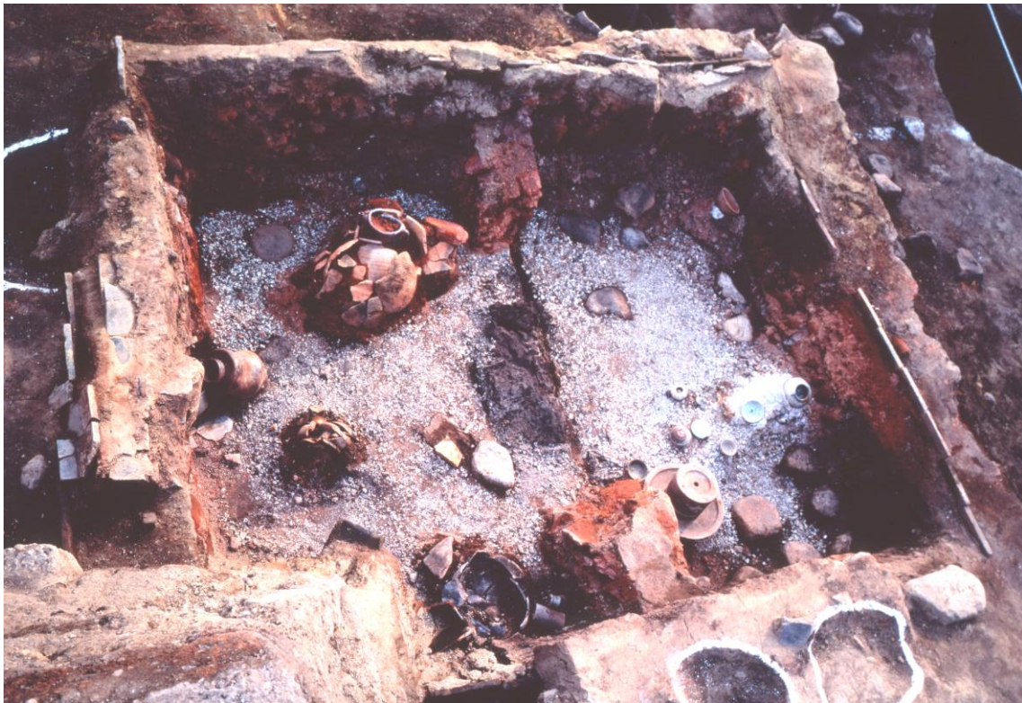
堺環濠都市遺跡（SKT39 地点） 埧列建物跡 SB302 内遺物出土状態