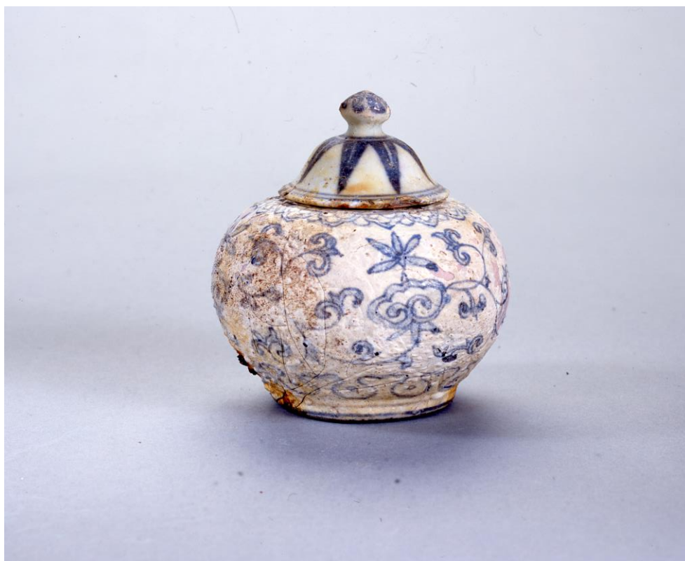
堺環濠都市遺跡（SKT39 地点）SB302 出土 中国染付蓋付壺（リスト No120・121）